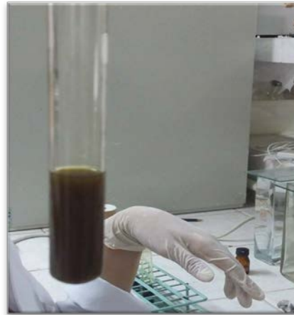
Figura 1. Pesquisa de saponinas no extrato de folhas de Croton heliotropiifolius Kunth.

A pesquisa de saponinas no extrato C. heliotropiifolius foi negativa, não sendo observada a presença de espuma persistente por 15 minutos. A figura 1 mostra a ausência de espuma persistente detectada no teste.