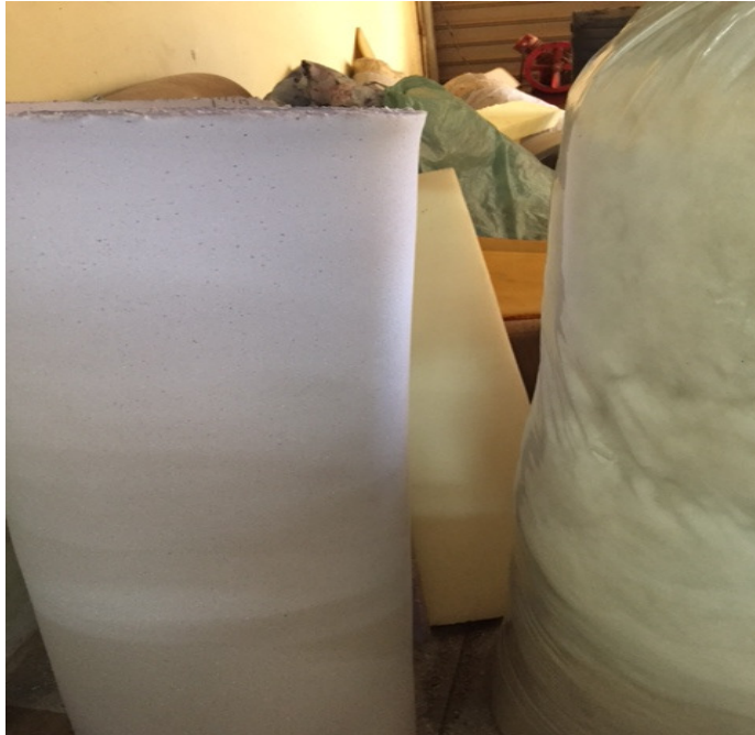
Figura 5. Rolos e saco de espuma. São de grande volume, porém de pouco peso, apresentam fácil manuseio e armazenamento