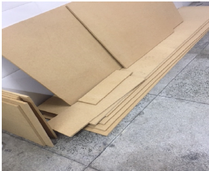
Figura 4. Armazenamento da matéria-prima (Madeira na forma de MDF). Onde a matéria-prima encontrasse cortada de tal forma que ajude no manuseio, e otimize aplicação da fase da produção