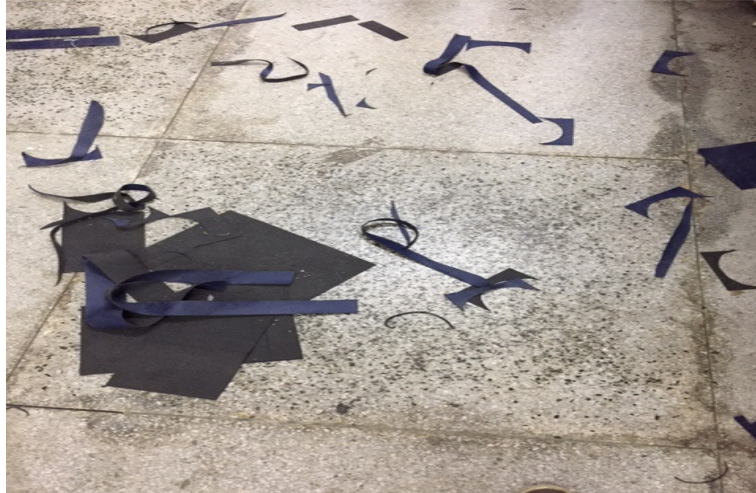
Figura 13. Resíduos de plástico. Proveniente do processo produtivo

A partir dos cortes, sobram pedaços onde esses quando muito pequenos não servem para a política de reutilização da unidade, assim caracterizando-se como resíduo.