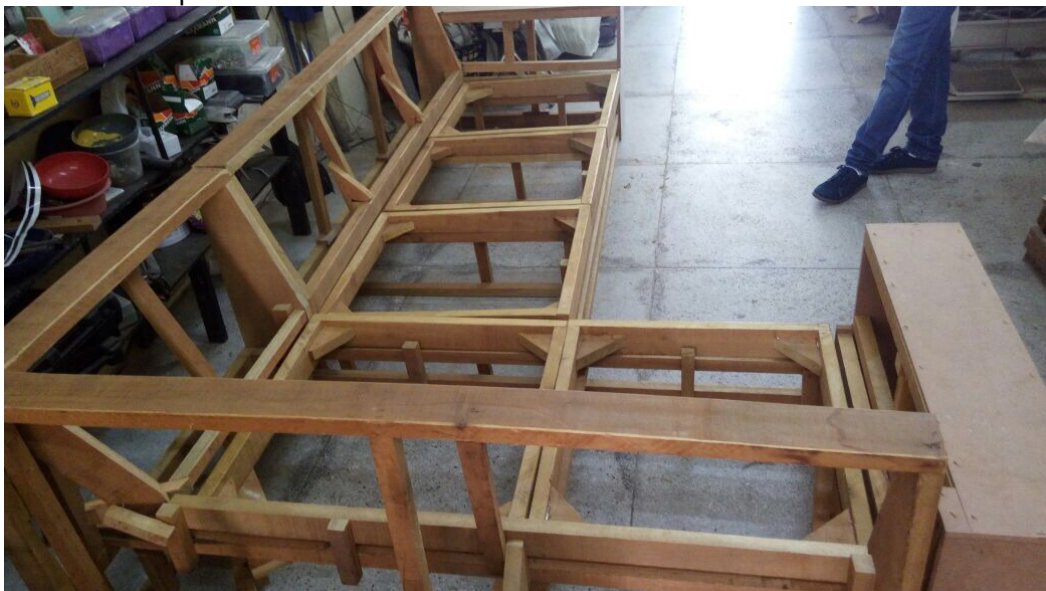
Figura 10. Gradeamento (estruturado sofá). Onde é feito o enquadramento do esquadro para estabelecer nivelado e alinhado toda a estrutura