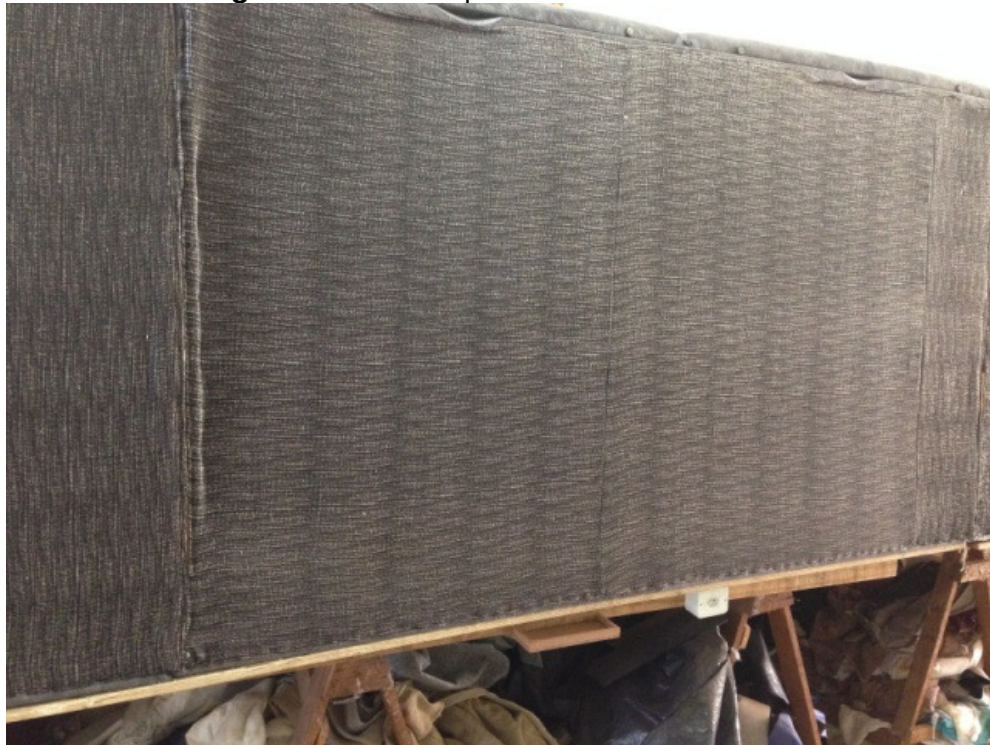
Figura 17. Tecido aplicado no fundo do sofá