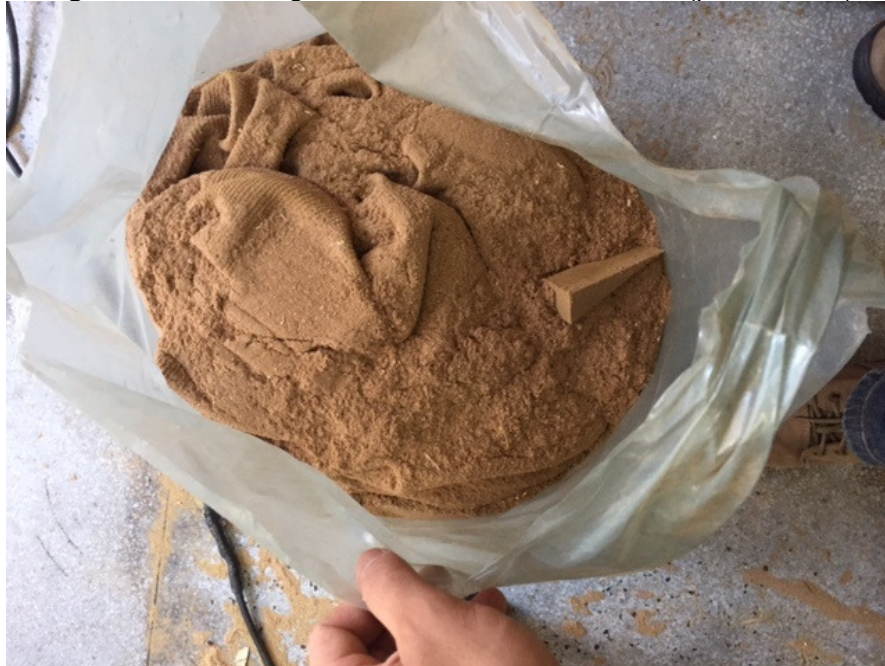
Figura 9. Resíduo gerado nos cortes da madeira (pó de serra)