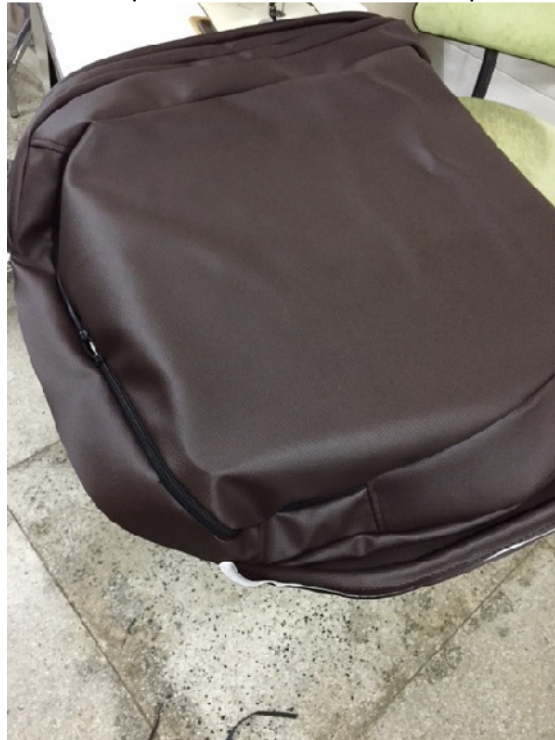
Figura 14. Acento de uma poltrona. Onde executa o procedimento da costura