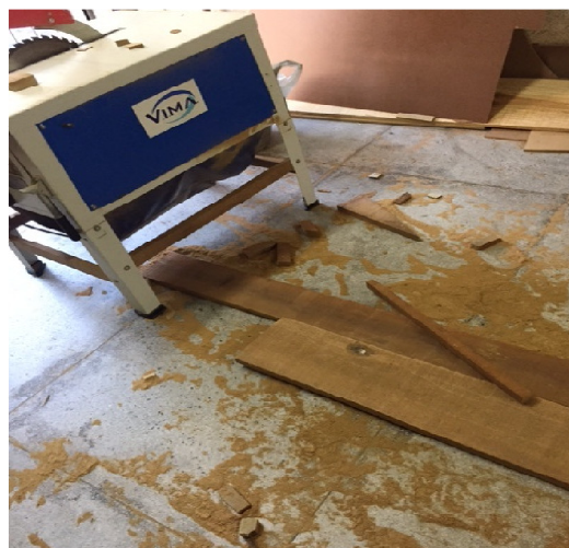
Figura 8. Resíduo gerado nos cortes da madeira (pó de serra)

Possui a geração dos pedaços da madeira e o pó de serra. Proveniente de todos os cortes realizados. Tais resíduos também atingem o sistema respiratório pela geração do pó de serra.