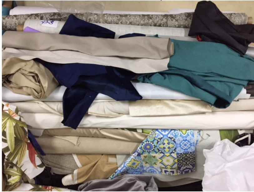
Figura 6. Rolos de tecidos. São recebidos enrolados para facilitar o manuseio e estocagem