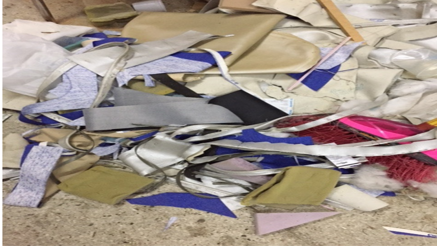
Figura 15. Resíduos gerados por todas as etapas de operação