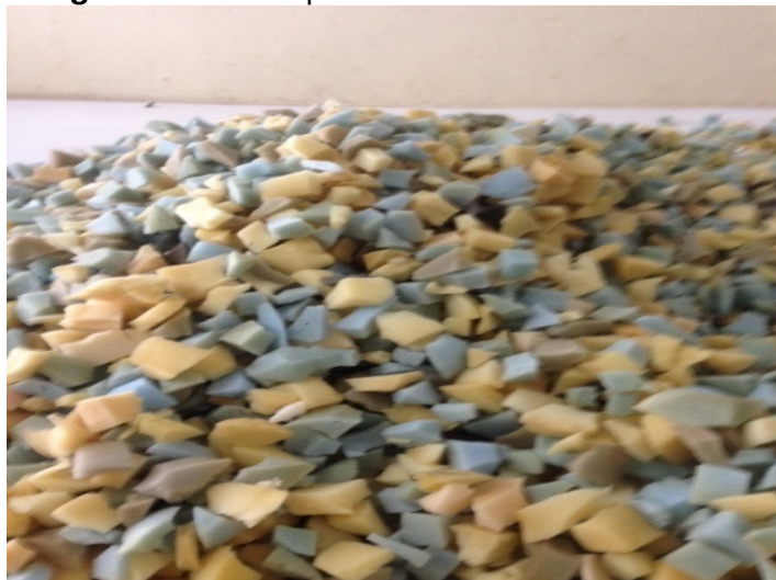
Figura 16. Flocos para enchimento de almofadas