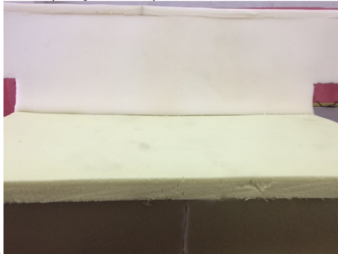
Figura 12. Aplicação das espumas nas estruturas de madeira