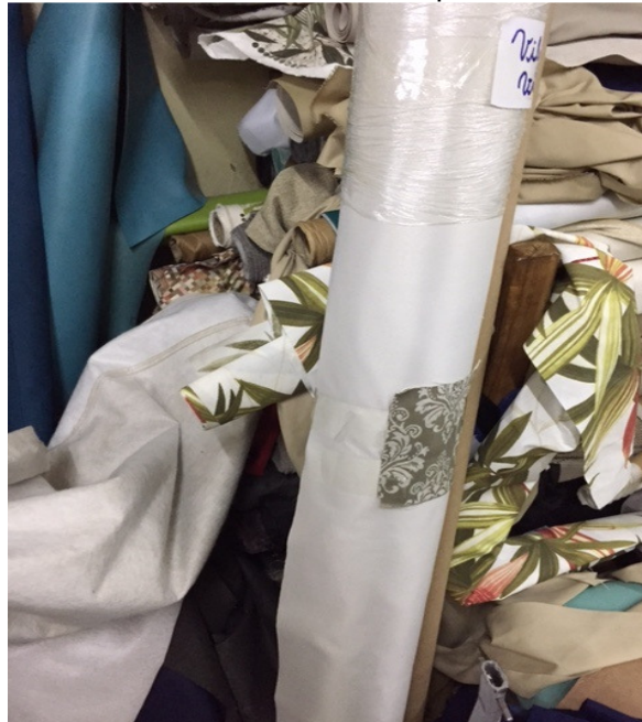
Figura 7. Rolos de tecidos. São recebidos enrolados para facilitar o manuseio e estocagem.