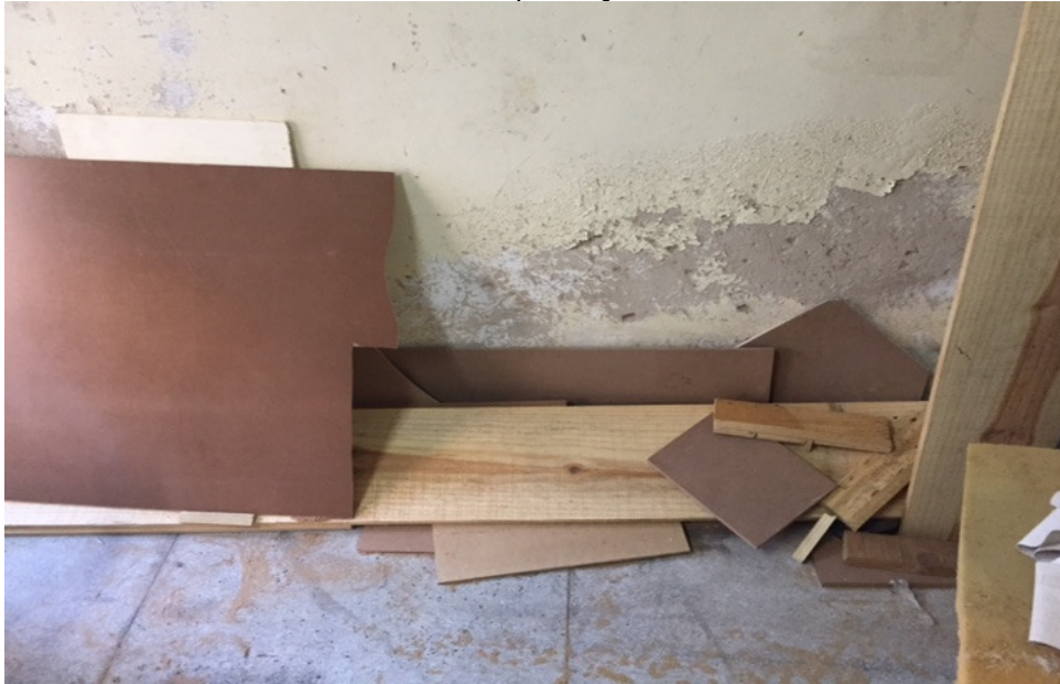
Figura 3. Armazenamento da matéria-prima (Madeira na forma de MDF). Onde a matéria-prima encontrasse cortada de tal forma que ajude no manuseio, e otimize aplicação da fase da produção