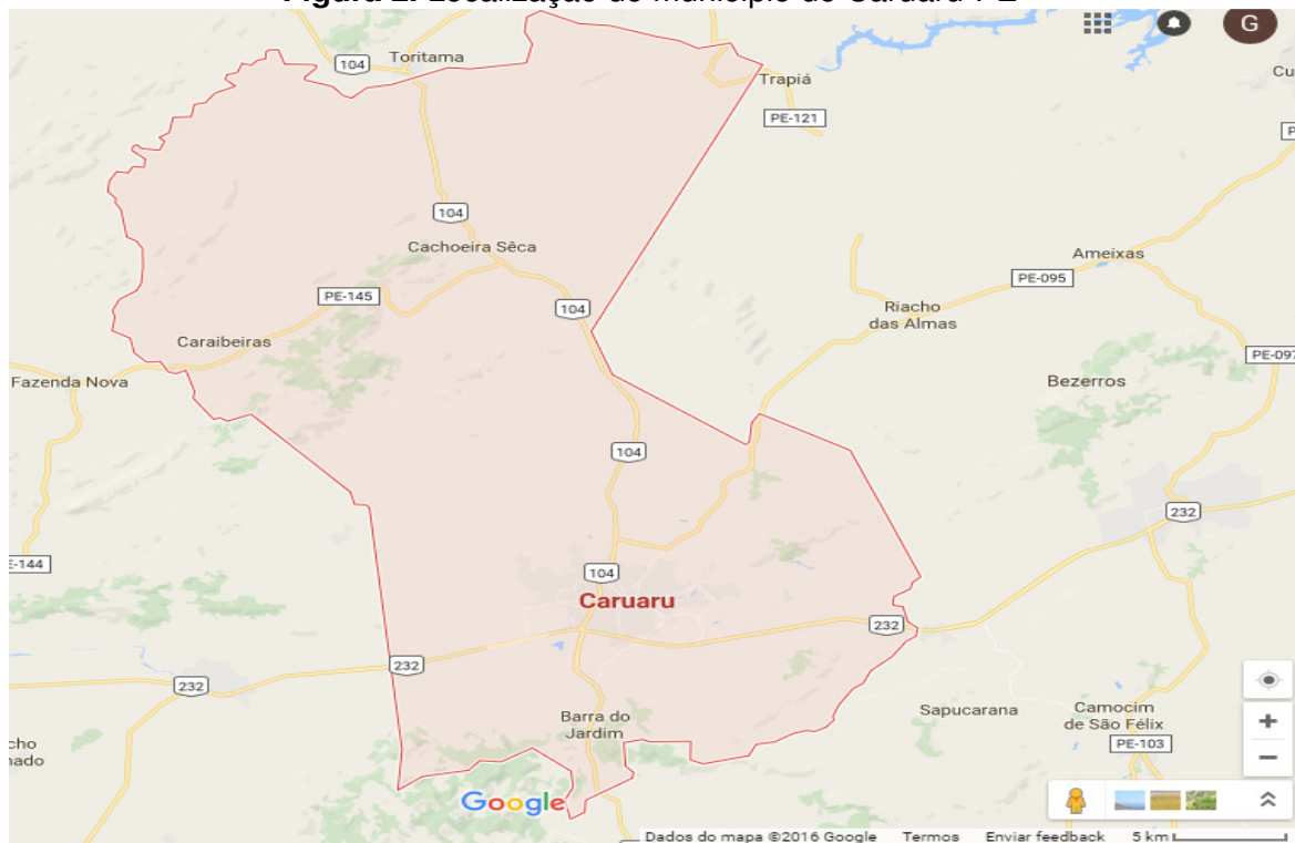
Figura 2. Localização do município de Caruaru-PE

O estudo foi realizado na cidade de Caruaru, localizada no Vale do Ipojuca com coordenadas ( 8^{\circ}14'19''\text{S} e 35^{\circ}55'17''\text{W} ) e altitude 550m, conforme Figura 2. O município ao longo dos tempos recebeu várias denominações, sendo conhecida também como a 'Princesa do Agreste', 'Capital do Agreste' e a 'Capital do Forró'. O município é o mais populoso do interior de Pernambuco, com uma população residente de 289.086 habitantes, conforme dados do IBGE, relativos ao ano de 2009, que vivem numa área territorial de 921 Km 2 . Atualmente Caruaru destaca-se como o mais importante polo econômico, médico-hospitalar, acadêmico, cultural e turístico do Agreste (BRASIL, 2016).