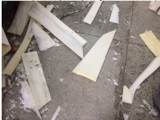
Figura 11. Resíduo gerado do corte da espuma. Atinge também o aspecto ambiental da poluição do ar, devido ao pó da espuma que é gerado durante o processo de corte

Gera o pó da espuma e pedaços, que são oriundos dos cortes e acabamentos realizados nessa matéria prima. O pó possui influência direta no aspecto da poluição do ar, pois são responsáveis por doenças respiratórias.